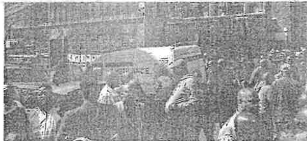
O número de mortos pode aumentar à medida que as operações de busca e resgate avançam

Quando o incidente teve início, era por volta da 1h30 no horário local e muitos moradores estavam dormindo. Conforme os dados divulgados, mais de 50 pessoas ficaram feridas. Quando chegaram ao local, as autoridades percorreram o prédio andar por andar em uma tentativa de encontrar sobreviventes. Testemunhas afirmaram a