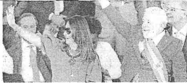
Antes de embarcar para a Índia, Lula participou de desfile de 7 de Setembro alusivo à Independência do Brasil

O presidente Luiz Inácio Lula da Silva embarcou na tarde dessa quinta-feira (07/09) em direção a Nova Déli, capital da Índia. No país, o mandatário brasileiro participará da 18ª Cúpula do G20, grupo que reúne as 19